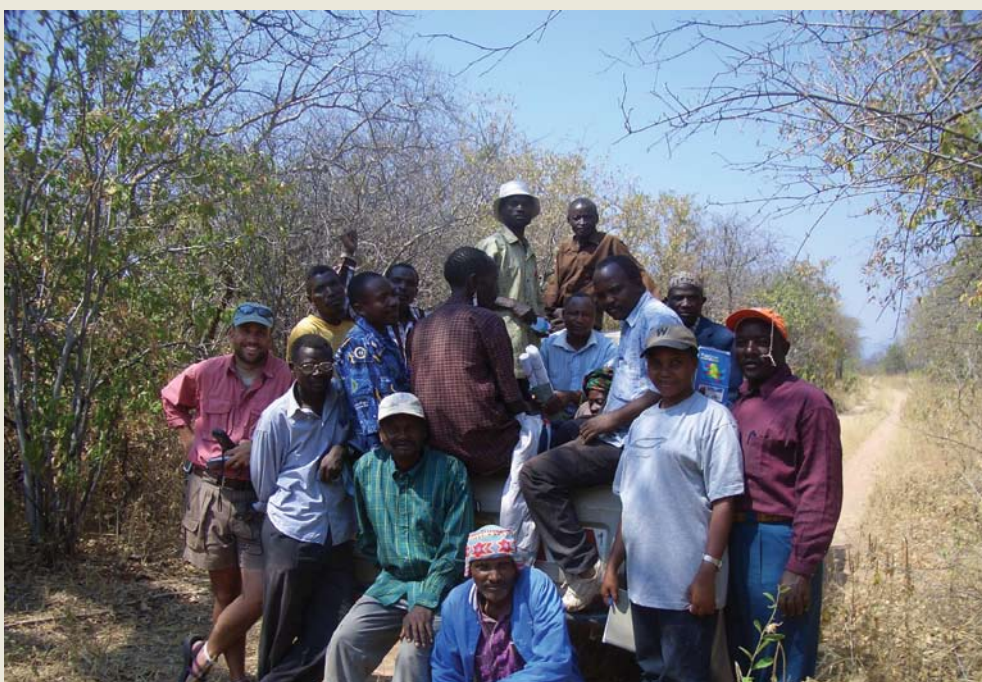
Kupanga matumizi ya ardhi katika WMA ya Idodi-Pawaga - kukubaliana maeneo ya malisho na yale ya wanyamapori kwa njia shirikishi

⇒ Awali, kanuni za uanzishwaji maeneo ya WMA ziko changamano na jamii zinahitaji msaada kutoka nje ili kutimiza masharti yote. Hii imehafifisha uanzishwaji wa WMA. Maeneo hayo kama yalivyoanzishwa ni aghali sana kuyaendeleza.