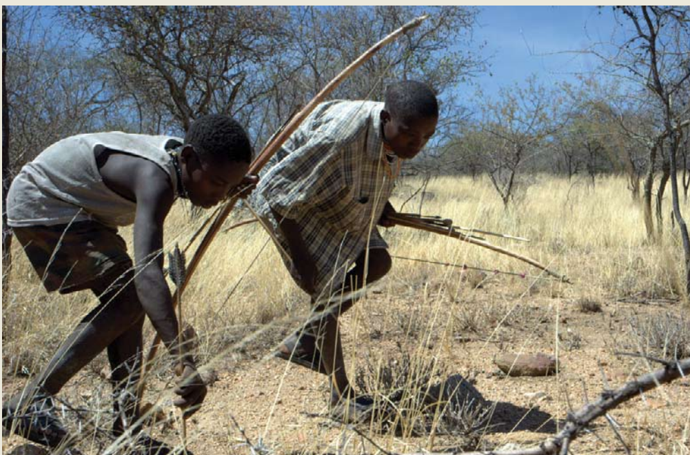
Wavulana wa kihadzabe wakikagua nyayo: Wanyamapori pia huwakilisha thamani ya kijamii na kiutamaduni isiyo na mbadala – baadhi yake zina zaidi ya miaka 40,000

Masuala haya ya kugawana mapato kwa sasa yanajadiliwa na wadau mbalimbali na Idara ya Wanyamapori kama yalivyojadiliwa katika Chapisho Na. 3.