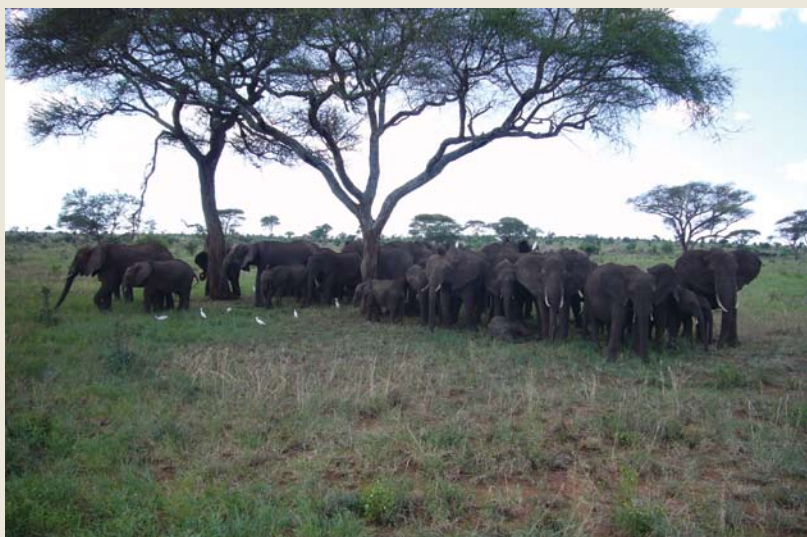
Tembo ( Loxodonta africana ) katika mfumo ikolojia wa Tarangire

Licha ya mwongozo sahihi wa tathmini ya sekta ya wanyamapori ya mwaka 1995 na Sera ya Wanyamapori Tanzania (toleo lililorekebishwa mwaka 2007), usimamizi wa wanyamapori kijamii bado haujatekelezwa vizuri – ikiwa na madhara kwa wanyamapori nchini.